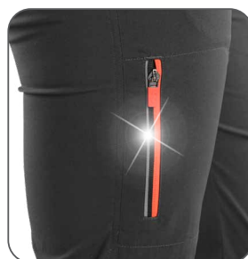
boční kapsa bočné vrecko side pocket boczna kieszeń