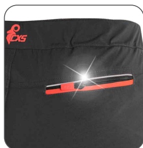
zadní kapsa zadné vrecko back pocket kieszeń z tyłu