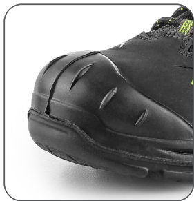
zesílená přední část proti okopu vonkajšia ochrana špičky reinforced PU overcap nosek z PU wzmocnieniem