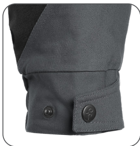
regulace manžety rukávu regulácia manžety rukáva sleeve cuff adjustment regulowany mankiet