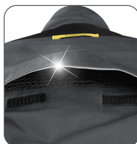
ventilace na zádech vetranie na zadnej strane ventilation on the back wentylacja z tyłu