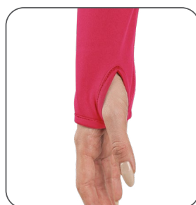
otvor na palec na rukávu otvor na palec na rukáve thumb hole on the sleeve otwór na kciuk na rękawie