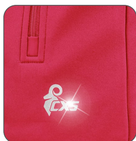
reflexní doplňky reflexné doplnky reflective accessories elementy odbłaskowe