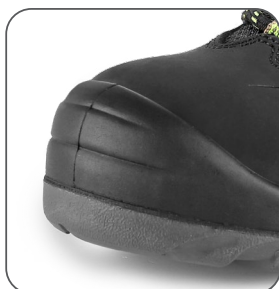
zesílená přední část proti okopu vonkajšia ochrana špičky reinforced PU overcap nosek z PU wzmocnieniem