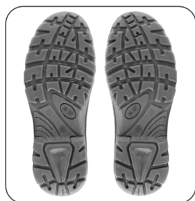
podešev podošva outsole podeszwa