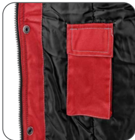
vnitřní kapsa vnútorné vrecko inner pocket kieszeń wewnętrzna