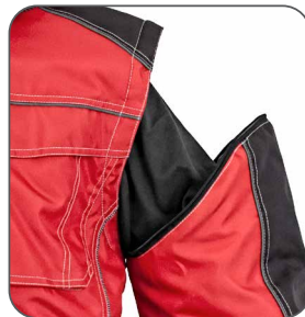
odepínací rukávy odnímateľné rukávy detachable sleeves odpinane rękawy