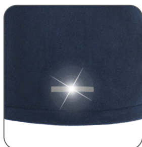
reflexní doplňky reflexné doplnky reflective accessories elementy odblaskowe