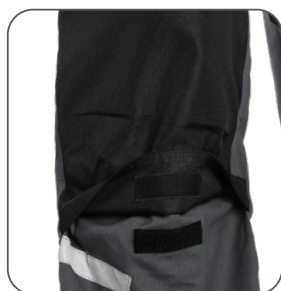
zesílená kolena s možností vložení výztuh reinforced knees with possibility to insert pads kolana wzmocnione z możliwością włożenia nakolanników