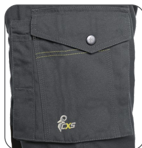
multifunkční kapsy na boku multifunkčné vrecká na boku multifunctional side pockets boczne kieszenie wielofunkcyjne