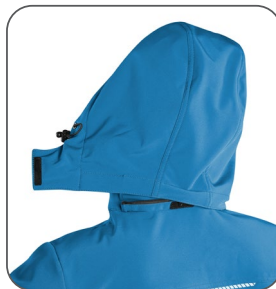
odepínací kapuce odnímateľná kapucňa detachable hood odpinany kaptur