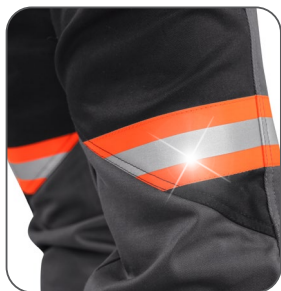
reflexní doplňky reflexné doplnky reflective accessories elementy odblaskowe