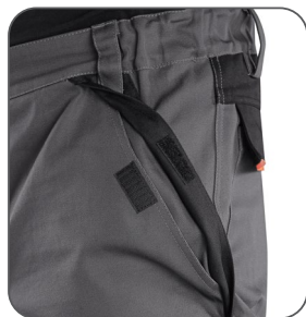
přední kapsa predné vrecko front pocket kieszeń przednia