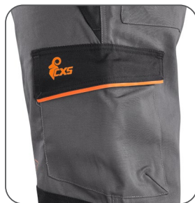
boční kapsa bočné vrecko side pocket kieszeń boczna