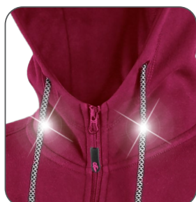
reflexní tkanice reflexné šnúrky reflective strings sznurówki odblaskowe