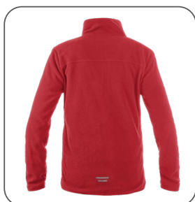
zadní strana zadná strana back side z tyłu