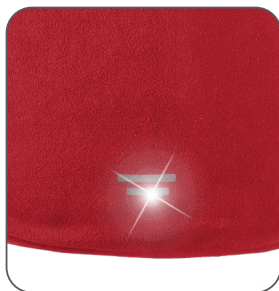
reflexní doplňky reflexné doplnky reflective accessories elementy odblaskowe