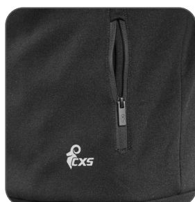
boční kapsa bočné vrecko side pocket kieszeń boczna