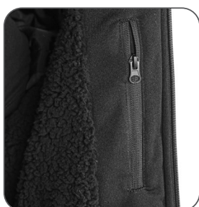
vnitřní kapsa vnútorné vrecko inner pocket kieszeń wewnętrzna