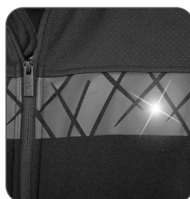
reflexní potisk reflexná potlač reflective printing nadruk odbłaskowy