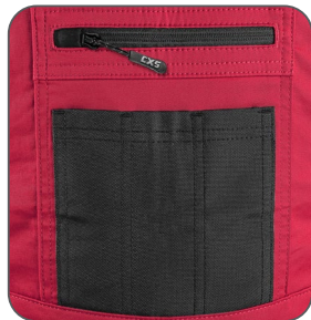
náprsní kapsy náprsné vrecká chest pockets kieszenie na piersi