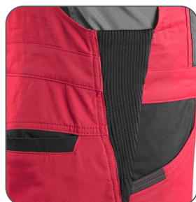
pruženka v bocích guma v bokoch elastic in the hips elastyczna gumka po bokach