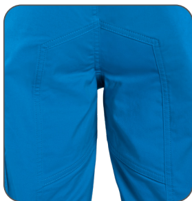
zesílený sed zosilnený sed reinforced seat wzmocnienie w kroku