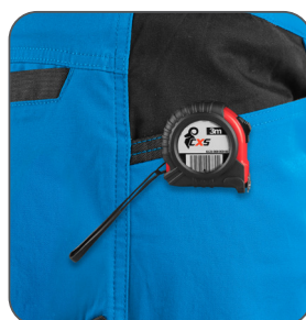
kapsa s vyztužením pro zavěšení metru vrecko s výstužou na zavesenie metra pocket with reinforcement for hanging a measuring tape kieszeń z wzmocnieniem do zawieszenia miarki