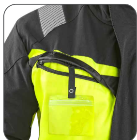
náprsní kapsa s odnímatelným pouzdrům ID karty náprsné vrecko s odnímateľným puzdrom na ID karty chest pocket with detachable ID card holder kieszeń na piersi z miejscem na ID kartę