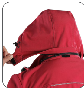
odepínací kapuce odnímateľná kapučňa detachable hood odpinany kaptur