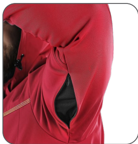
větrání v podpaží vetranie v podpazuší underarm ventilation wentylacja pod pachami