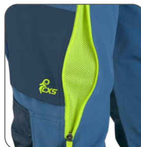
ventilace na stehně ventilácia na stehne thigh ventilation wentylacja na nogawce